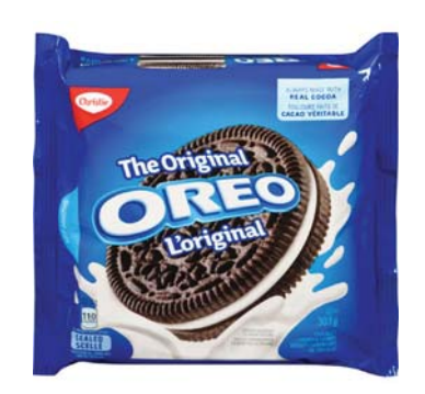
▲ 303그램이 올해 초에 270그램으로 줄어든 오레오

그의 설명을 들어본다. "이런 변화는 여러 요인들이 복합한 결과이다. 그 러나 가장 중요한 요인은 크게 높아진 원가 상승때문이며 이쪽 업계가 당 분간 겪어야 할 과제다. 고객에 부담주지않으려고 열심히 노력하고 있지 만 지구촌 수백만 소비자가 애호하는 오레오의 맛과 수준을 유지하기 위 한 타협점을 찾기가 결코 쉽지 않았다."