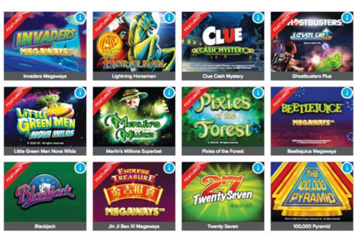
▲ ALC에서 개발해 뉴브런스윅에서 시행 중인 iCasino 게임의 일부. alc.ca 싸이트에서 화려하게 소개하고 있다.

고객의 최대 지출액 등 자세한 정보에 대해서는 영업 기밀에 부치며 언 급을 피하는 공사측은 대서양 타 지역 정부도 향후 수년간 온라인 카지노 게임 프로그램을 도입해볼 것을 열심히 권하는 중이라고 한다.