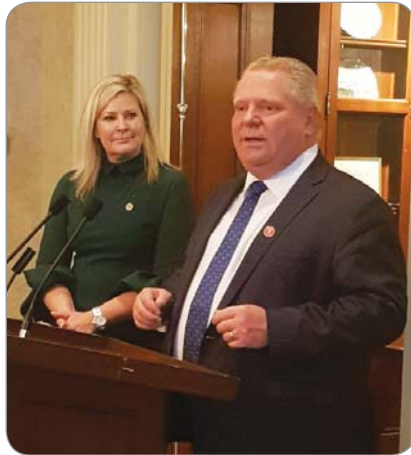
▲ 호가쓰 의원 후원회 밤 행사에 직접 참가해 환영사를 하고 있는 포드 수상. 옆에 호가쓰 의원이 지켜보고 있다.