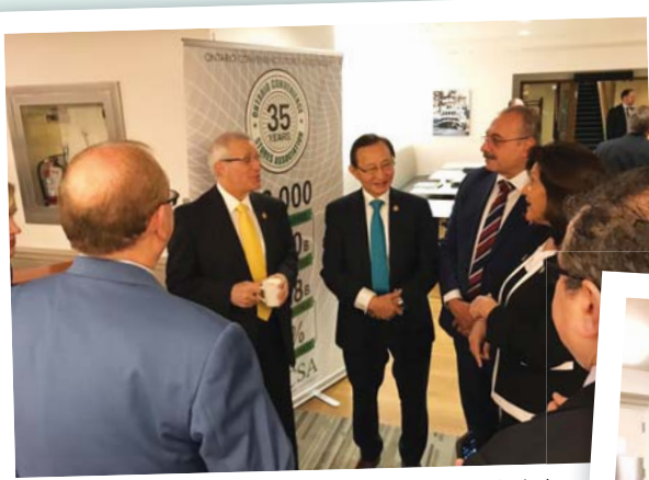
편의점 관계자들에 둘러싸여 빅 피델리 재무장관(왼쪽)과 조성준 노인복지부 장관이 답소를 나누고 있다.