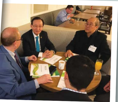
오후에 있을 의원 접촉 전략 회의를 논하고 있다.