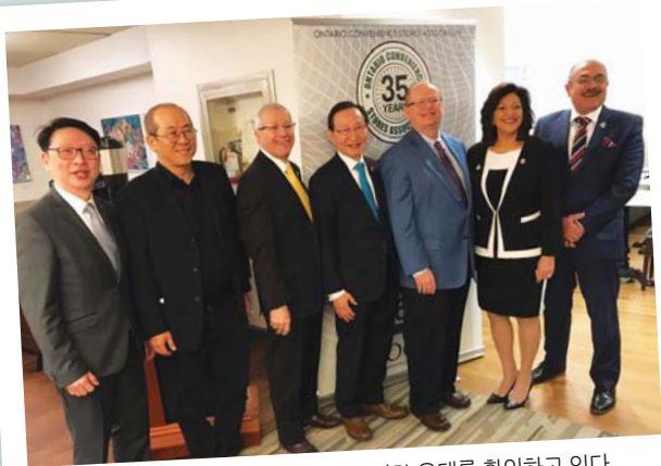
온주편의점업계 관계자들과 정부가 굳건한 유대를 확인하고 있다.