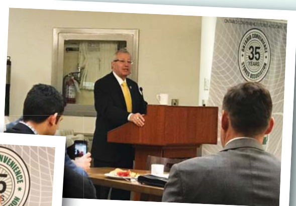
피델리 재무장관이 편의점 업계와 관련된 정부측 예산 관련 정책의 핵심을 설명하고 있다.