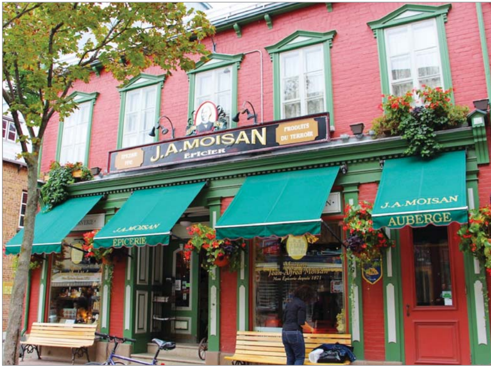
▲1층은 식료품 중심의 편의점, 2층은 B&B로 운영하는 150년 전통의 퀘벡 소재 J.A.Moisan

퀘벡주 퀘벡시에서 '제이에이 모이즌'(J.A.Moisan)이라는 식품점이 있다. 편의점이라고 해도 무방하다. 북미주에서 가장 오래된 잡화점으로 기록되고 있는 유서깊은 가게다. 그 옛날에는 편의점이라는 용어가 생기지도 않았으며 보통 잡화점(general store)라고 했으니 이 업소는 북미주에서 현존하는 최고(最古)의 편의점이라고 불러도 과장은 아닐 것 같다.