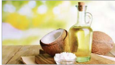
▲건강과 미용에 좋은 오일로 각광받는 코코넛 오일. 적정량 소비가 중요하다.

새를 중화시켜 냉장고에 두거나, 빵을 만들때 사용하는 것으로만 알지만 실제로 염증치료에 좋고 세포를 중화시켜 암세포 사멸에 도움이 되고 신장 결석을 방지해 주는 매우 고마운 식품이다. 찬물에 반 티스푼의 소다와 꿀(Raw Honey)을 약간 섞어서 아침 저녁으로 공복에 마시면 된다. 또한 부위를 막론하고 피부종양에 소다와 코코넛 오일을 섞어 만든 연고를 바르면 좋다.