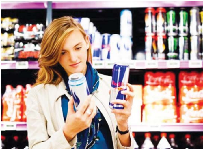
▲ 영국에서는 최근 편의점들도 16세 미만의 미성년자들에게 에너지 드링크를 판매하지 않는 캠페인이 힘을 얻어가고 있다. 그래서 신분증 제시 요구가 과거 보다 더 빈번해지고 있다. 담배, 복권에 이어 하나 더 늘어난 것이다.

에너지 드링크가 미성년자에게 부작용을 일으키는 일련의 사건들을 겪고 업계 내부에서 먼저 판매 금지 캠페인이 자발적으로 벌어진 영국에서는 문제의 본질적 해결을 위해 마침내 의회가 나섰다.