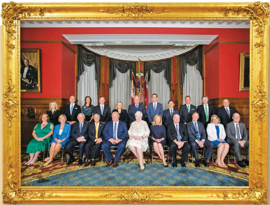
▲ 지난 6월 7일 온타리오 총선에서 재선에 성공한 보수당 소속 조성준(Raymond Cho)의원이 새로 출범하는 더그 포트 정권의 노인복지부 장관(Minister for Seniors and Accessibility)에 임명됐다. 조 의원에 대한 한인 사회의 관심과 기대가 더 커지게 됐다. (6월 29일 오전에 임명 직후 더그 포트 수상과 기념촬영. 뒷줄 오른쪽에서 네번째)

The Ontario Korean Businessmen's Association News 2018년 7월 4일 수요일 제754호